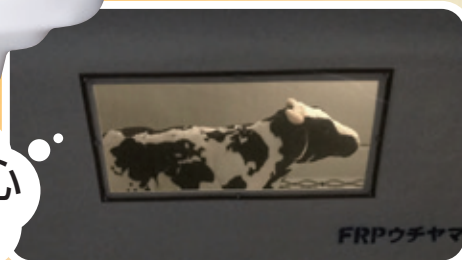
ヒーターと連動してお使い頂くと大変便利です