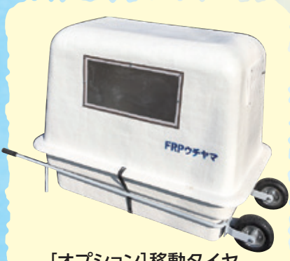
[オプション]移動タイヤ

仔牛が1頭入るほどの大きさで、出生直後の仔牛を数時間入れる。温風ヒーターが付属しており、温かい空気を仔牛のお腹から送り込み、仔牛を乾かし暖める。